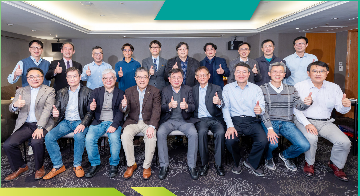
1月24日 第十一屆第一次理事會議大合照